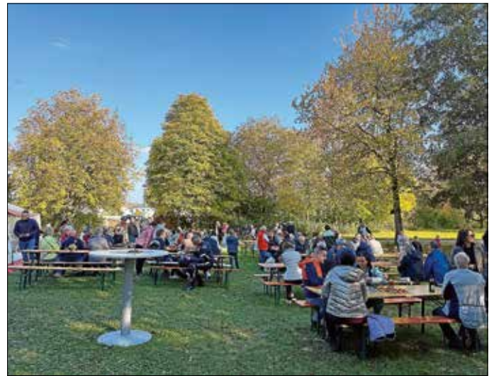
Zahlreiche Besucher kamen wieder zum Apfelfest

Zusammen war es ein ereignisreiches Jahr, das dank der engagierten Mitglieder zu einem gelungenen Gemeinschaftserlebnis wurde.