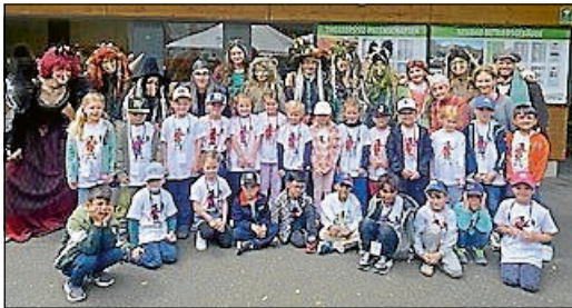
Ausflug ins Naturtheater Reutlingen

Auch in diesem Jahr hat sich in unserer Einrichtung viel bewegt. Die umfangreichen Umbaumaßnahmen konnten im laufenden Betrieb fortgeführt werden. Wir freuen uns über neue Toilettenanlagen, die erneuerten Türen sowie die modernisierte Garderobe. In einer unserer Gruppen entsteht zudem eine zweite Spielebene, die den Kindern künftig noch mehr Raum zum Entdecken und Spielen bietet. Auch im Außenbereich hat sich einiges getan: Die Anlagen wurden mit Robinienholz verkleidet und wirken deutlich hochwertiger. Ein besonderes Highlight war erneut die Kleiderbörse, die dieses Mal in der Täleseehalle stattfand und vom engagierten Elternbeirat organisiert und durchgeführt wurde.