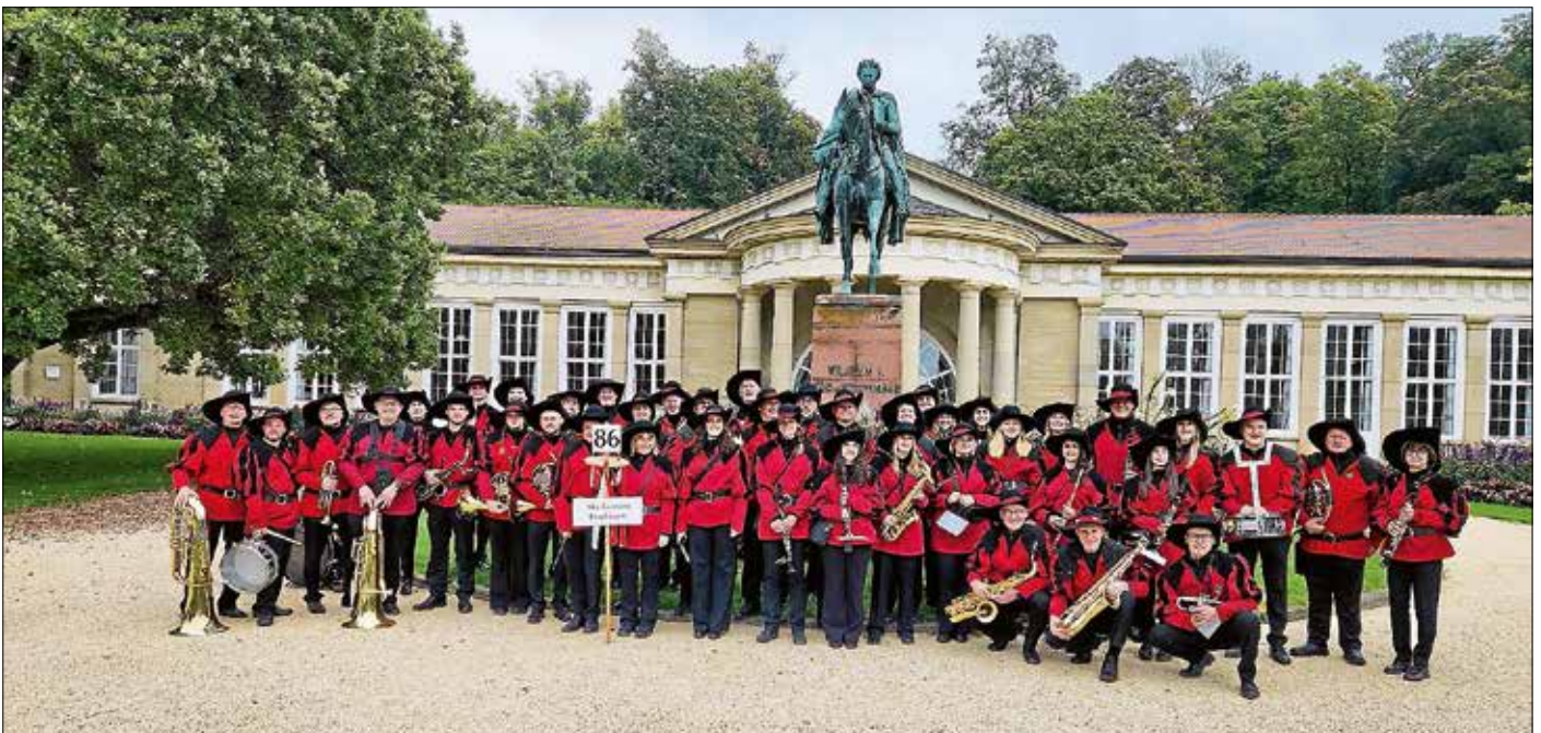
Der Musikverein Empfingen im Kurpark Bad-Cannstatt beim Cannstatter Volksfestumzug