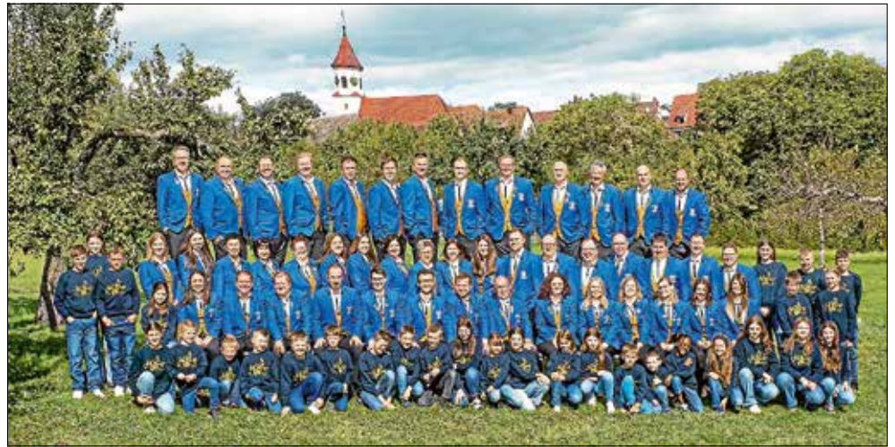
Gesamtbild Musikverein Wiesenstetten

Mit unserem Jahreskonzert im Advent, einer Weihnachtsfeier nach der letzten Musikprobe sowie dem traditionellen Heilig-Abend-Spielen ging das Vereinsjahr zu Ende.