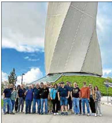
Ausflug zum Thyssen Testturm in Rottweil

Unser Ausflug fand vom 30.-31.08.25 statt. Unser erstes Ziel war eine Führung beim Thyssen Testturm in Rottweil. Weiter ging es zum Mittagessen und einer kleinen Wanderung zum Schausinsland bei Freiburg. Nachdem wir im Hotel in Endingen am Kaiserstuhl eingekcheckt hatten, ging es zum Weinfest nach Breisach.