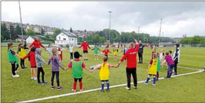
Mädels Power SGE

Die Fußballabteilung bedankt sich für ein ereignisreiches Fußballjahr 2025 bei allen Trainern, Helfern und Unterstützern – ohne euch wäre dies nicht möglich.