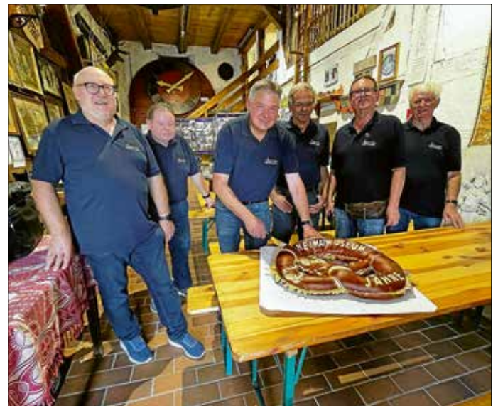
Die Gemeinde spendierte dem Heimatkreis zum Jubiläum 25 Jahre Museum eine Riesenbrezel.

Viel Zeit kostete die Erfassung der Fotos, die man von der Neckar-Chronik erhalten hatte. Regelmäßig bestückte der Heimatkreis den Kubus im Rathaus mit geschichtlichen Exponaten.