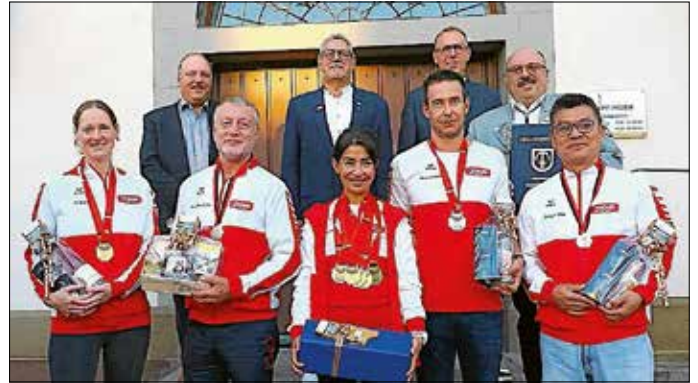
Die erfolgreichen Sommerbiathleten bei der Sportlerehrung

titel sowie drei weitere Podestplätze freuen, was zu einer Ehrung mit Eintrag ins Goldene Buch der Gemeinde Empfingen führte.