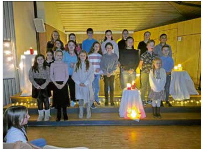
Musiker vom Jahreskonzert