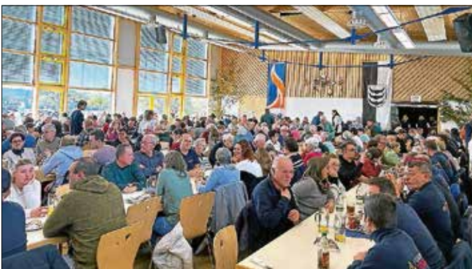
Viele Besucher beim Tag der offenen Tür

Es waren zwei wunderschöne und kameradschaftliche Tage. An unserem Tag der offenen Tür mit Schlachtplatte konnten wir am 25.-26.10.25 wieder viele Besucher begrüßen.