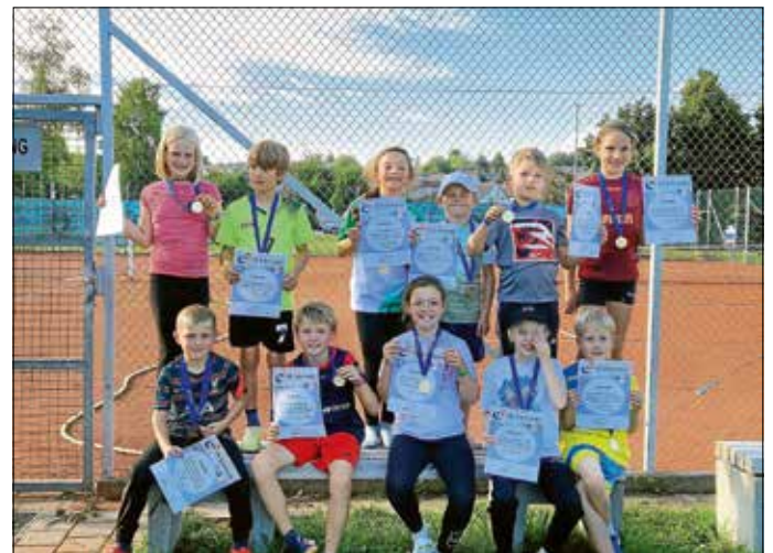
Die stolzen Kinder der U9 bei ihrem Rundenabschluss

Besonders stolz ist der TCE auf seine erfolgreiche Jugendarbeit. 60 Kinder trainierten in 28 Wochenstunden bei 5 Trainern, um an den Spieltagen große Erfolge einzuspielen und sich in ihren jeweiligen Ligen die vordersten Plätze zu sichern. Den Juniorinnen U15 und den Junioren U18 gelang zudem der Aufstieg. Beim schulischen Wettkampf „Jugend trainiert für Olympia“ erreichten die Kinder des TCE den zweiten Platz im Finale des Regierungsbezirkes.