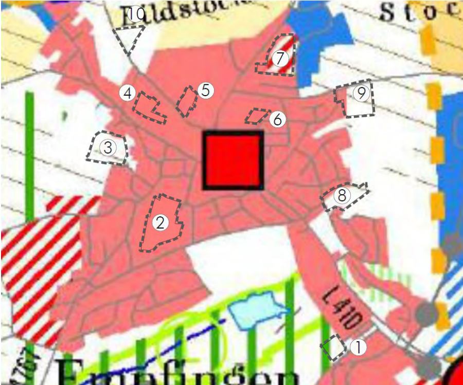
Abb. II-1: Ausschnitt Teilregionalplan mit Untersuchungsgebieten