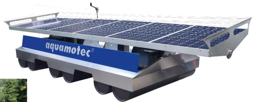
Abb. 2 Anlage 6-SI mit zwei Motoren – ohne Schlauch dargestellt