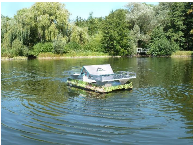
Abb. 3 Anlage 2-SI mit einem Motor – im Solarbetrieb kosten- und CO 2 neutral